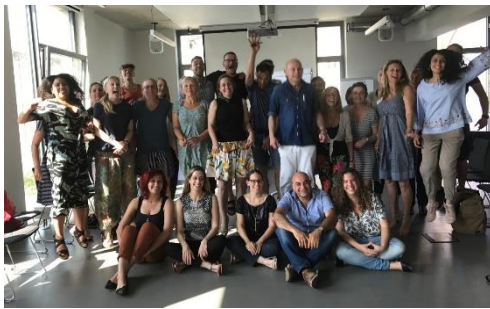
Teilnehmer/innen des zweiten Basistrainings auf dem Berliner Pfefferberg im April 2018